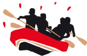
DEPORTES DE AVENTURA

Para la consecución de los anteriores valores, el campamento se basa en 3 grandes bloques , repartidos en todas las actividades del campamento: